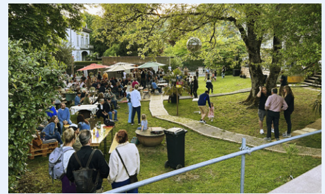
Auch nach Sonnenuntergang feierte die Gesellschaft munter weiter.