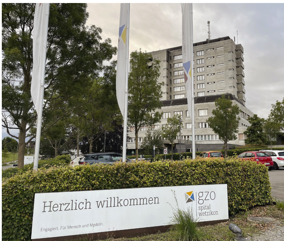
Das GZO Spital Wetzikon kämpft ums Überleben.

Die Gruppe betreibt über 20 Spitäler in der ganzen Schweiz, darunter auch die Privatklinik Bethanien in Zürich und die Rosenklinik in Rapperswil. Die Immobilien könnten dabei von einer amerikanischen Investmentfirma – die Gläubigerpapiere der GZO hält – übernommen und dem Spital vermietet werden. Einen ähnlichen Deal schloss eine Schwesterfirma des Swiss Medical Networks mit dem ebenfalls kriselnden See-Spital Horgen ab. Um das Angebot zu prüfen, beantragen die GZO und die Sachwalter eine Verlängerung der Nachlassstundung bis im Dezember 2026 und verschieben die Gläubigerversammlung auf ungewisse Zeit. Sollte sich das Angebot als seriös und für die Gläubiger als vorteilhaft erweisen, sind die Aktionärgemeinden grundsätzlich zum Verkauf verpflichtet.