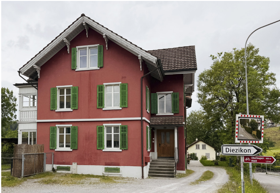
Ein leeres Haus und offene Fragen: das ehemalige Haus der Casa OmBra in Laupen.

Mit dem Wegzug der Casa OmBra, einem Wohnheim für Menschen mit einer psychischen Beeinträchtigung, wirft die WAZ einen Blick auf den Bestand der psychiatrischen Langzeitpflegeplätze in der Gemeinde.