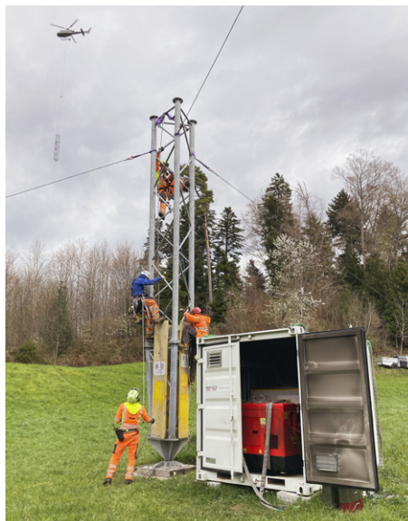
Demontage des Windmessmasts auf dem Batzberg.

Ursprünglich hatte das Projektkonsortium – bestehend aus EW Wald, SN Energie AG und den St.-Gallisch-Appenzellerischen Kraftwerken (SAK) – geplant, den Mast Ende 2025 wieder zu entfernen und die Bevölkerung im Juni 2025 über die Messresultate und das weitere Vorgehen zu informieren. Es zeigte sich jedoch bald, dass eine einzige Messperiode im ertragreicheren Winterhalbjahr