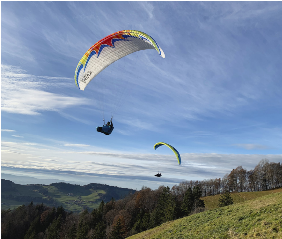
Hangsegeln an der Alp Scheidegg.